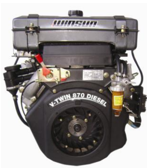
R2V870-V2 2κύλινδρος, με ρεζερβουάρ